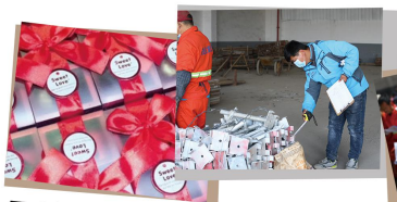
三八妇女节巧克力